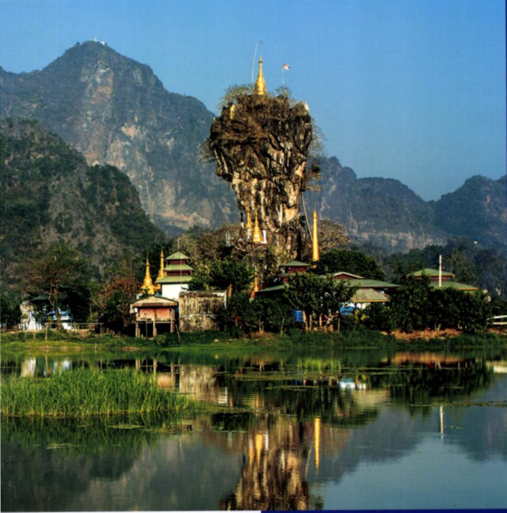
Aus sattgrünen Reisfeldern ragende Felsnadeln mit Klöstern oder Pagoden obendrauf sind das Markenzeichen der Landschaft rund um Hpa-an. Spektakulärstes Beispiel: das zehn Kilometer südwestlich inmitten eines Sees auf einer Kalkspitze thronende Heiligtum von Kyauk Ka Lat.