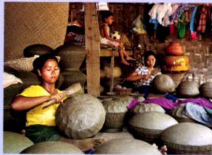
Die Töpferkunst zählt zwar nicht zu den sogenannten „zehn Blumen“, jenen Branchen, in denen Myanmarische Handwerksmeister einen besonders hohen Grad an Perfektionismus erreicht haben. Doch Fingerfertigkeit und Ästhetik – im Bild eine Werkstatt in dem für Keramikherstellung bekanntesten Dorf Yamlahe am Irrawaddy – sind auch auf diesem Gebiet äußerst beachtlich.