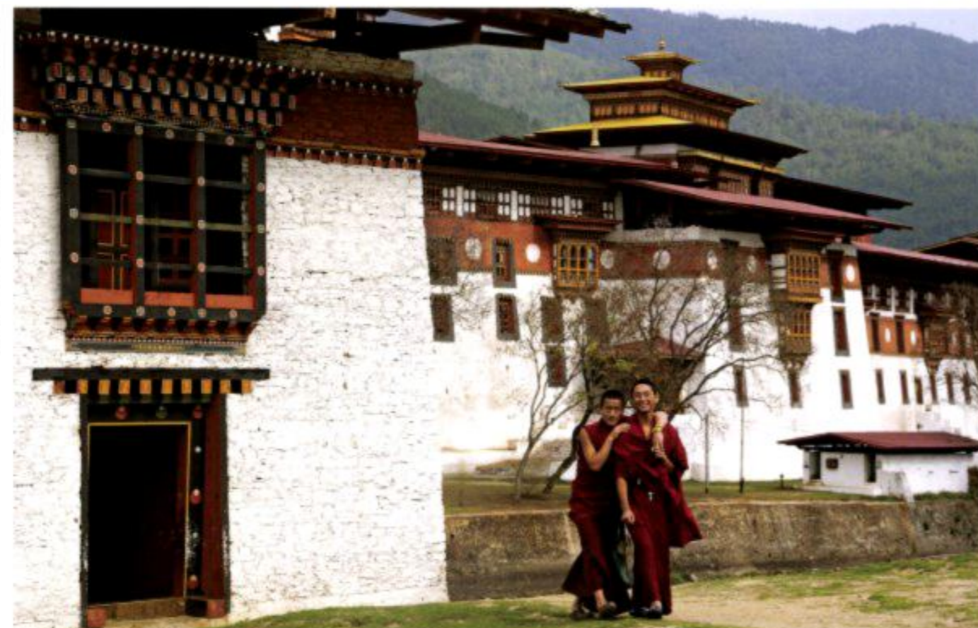
Oben und rechts: Der Punakha-Dzong liegt auf einer schmalen Landzunge am Zusammenfluss von Mo- und Pho-Chhu. Als 1994 – nicht zum ersten Mal – oben in den Bergen der natürliche Damm eines Gletschersees barst, rissen die Fluten zwei Dutzend Menschen in den Tod. Die damals zerstörte, hölzerne Hängebrücke wurde inzwischen mit schweizerischer Hilfe rekonstruiert.