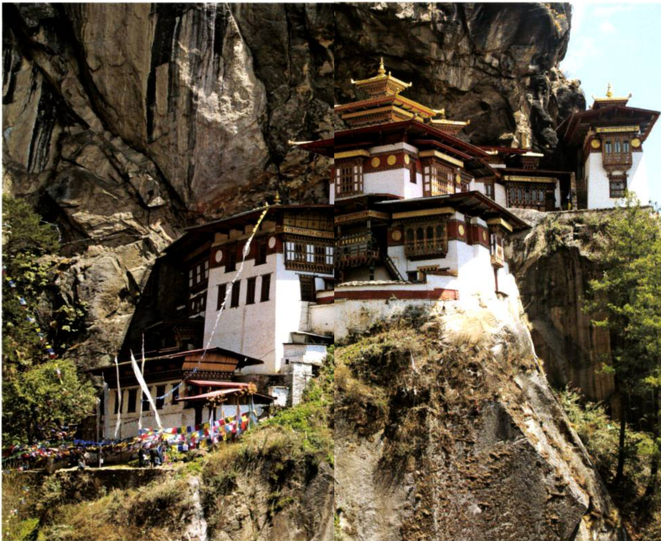
Hoch über dem Paro-Tal thront auf einer 900 Meter hohen Felsklippe das wohl berühmteste Kloster des Landes – Taktshang. Der Legende nach floh Padmasambhava alias Guru Rinpoche von Tibet aus auf einer Tigerin hierher, um in einer kleinen Höhle zu meditieren. Taktshang heißt übersetzt „Tigernest“.

Das nunmehr buddhistische Land blieb freilich noch jahrhundertlang politisch zersplittert. Erst gegen Mitte des 17. Jahrhunderts gelang es einem gewissen Ngawang Namgyal das „Land der südlichen Täler“ zu einen. Der charismatische Lama, seines Zeichens Oberhaupt des tibetischen Klosters Ralung und als solches Angehöriger der einflussreichen Drukpa-Sekte, war 1616, als die Gelbmützen-Sekte des Dalai Lama die Kontrolle über die Provinz Lhasa gewann, nach Bhutan geflohen. Dank seiner fulminanten Predigten gewann er alsbald die Unterstützung der wichtigsten Adelsfamilien, die sich bis dahin, über jeweils eigene kleine Fürstentümer regie-