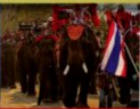
National Elephant Day

Eine Welt für sich ist der Norden Thailands, der sich, vereinfacht dargestellt, durch den 17. Breitengrad vom Rest des Königreiches abgrenzen lässt. Hier, in den fruchtbaren und deshalb landwirtschaftlich schon früh intensiv genutzten Tälern und Becken des Berglandes stand die Wiege der thai-buddhistischen Kunst, Kultur und Tradition. Hier blühten zwischen dem 11. und 14. Jahrhundert Reiche, in deren Zentren, von Chiang Rai bis Kamphaeng Phet und speziell in Chiang Mai, Lamphun und Sukhothai, sich jene höfischen, religiösen und weltlichen Bräuche und Sitten entwickelten, die bis in die Gegenwart fortbestehen. Prägend waren diesbezüglich lange Zeit die Einflüsse der Mon und über dieses Volk die Beziehungen zum benach-