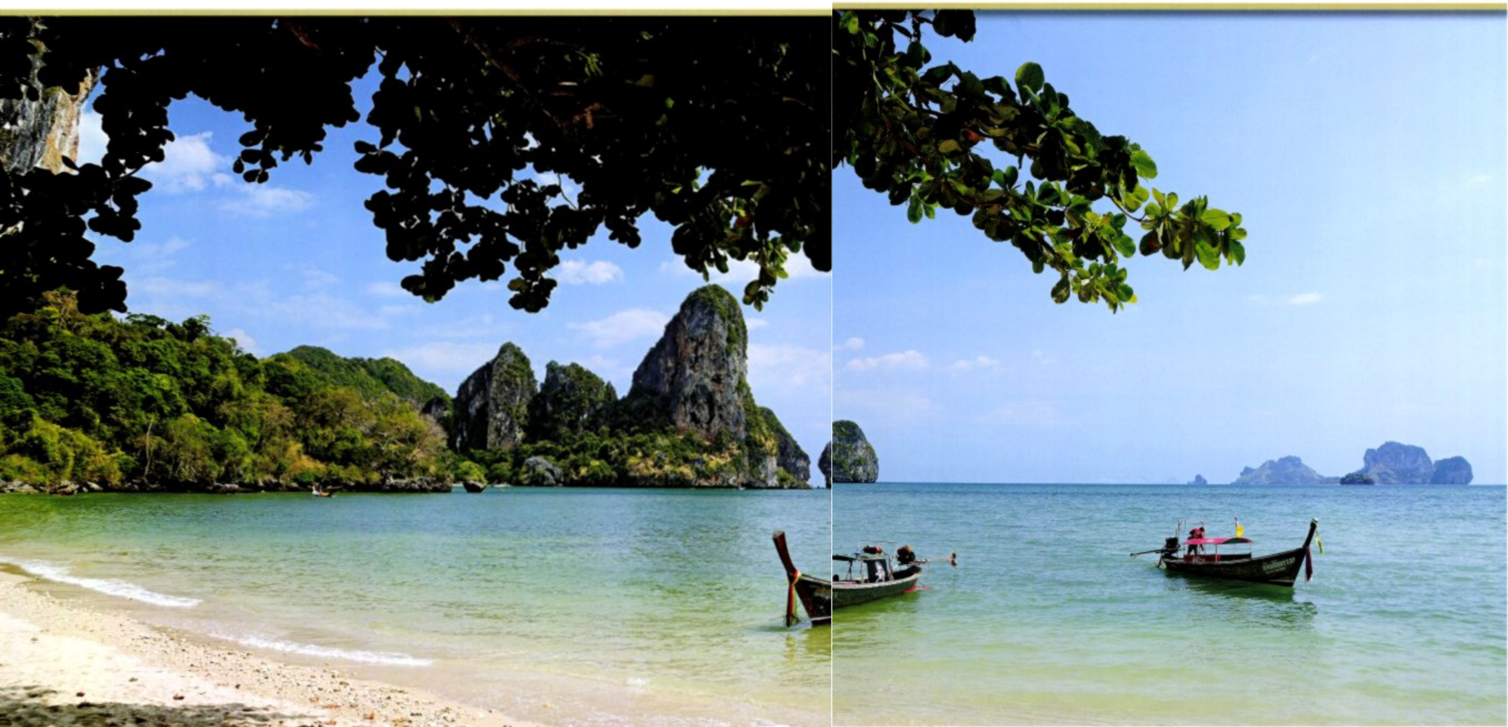
An den Gestaden der Andamanensee. Die Umgebung des kleinen Fischerhafens Krabi zählt mit ihren wunderschönen Sandstränden, den Karstfelsen und kleinen Inseln zu den beliebtesten Urlaubszielen Thailands.

das mit 513 000 Quadratkilometern etwa eineinhalbmal die Fläche Deutschlands umfasst und rund 70 Millionen Einwohner zählt, von allen Staaten Südostasiens mit Abstand die meisten Auslandsgäste anlockt – plusminus zwanzig Millionen im Schnitt der letzten Jahre. Und kein Wunder auch, dass der Tourismus mittlerweile rund zehn Prozent zum Bruttoinlandsprodukt beiträgt und als Devisenbringer längst den Reis überholt hat, der noch vor zwei Generationen die Haupteinnahmequelle der Thais