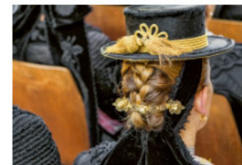
Die Salzburger Tracht, mal super fein, mal modisch, erlebt eine Renaissance – Seite 279