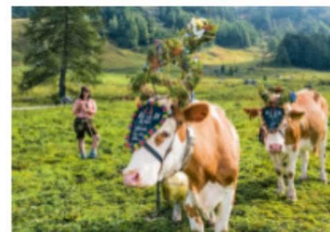
Immer was zu gucken beim alljährlichen Almabtrieb – Seite 209