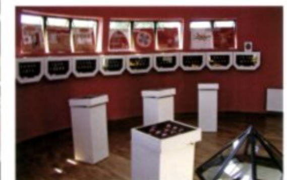
Sammlung von tausenden kunstvoll verzierten „pysanky“ aus allen Teilen der Westukraine.