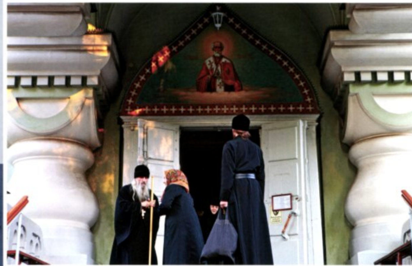
Links: Das Pokrovskij-Kloster geht auf eine Gründung der Großherzogin Alexandra Petrovna aus dem Jahr 1889 zurück. Ihre Stiftung umfasste Wohlfahrts-einrichtungen wie Waisenhaus, Apotheke und eine Poliklinik für Bedürftige. Zwischenzeitlich wurde ein Großteil der Anlage als Spital genutzt, heute erfüllt sie erneut ihre ursprüngliche geistige Funktion.