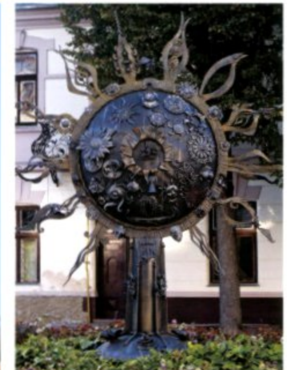
schmiede. Im Rahmen eines internationalen Festivals demonstrieren hunderte Mitglieder dieser Zunft aus ganz Europa öffentlich ihr Können.