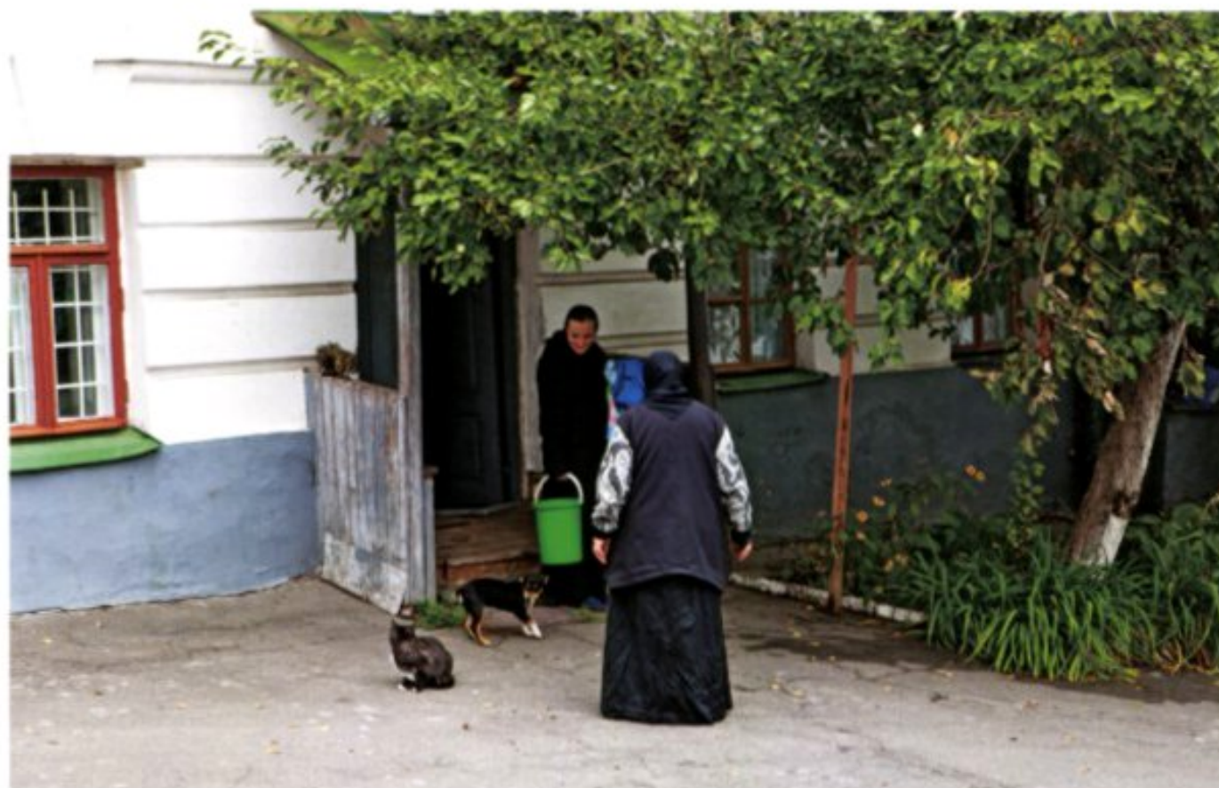
Das Florovskij-Kloster wurde im späten 15. Jahrhundert am Nordrand der Oberstadt von Kiew erbaut und umfasst mehrere sehenswerte Kirchen. Im Zuge der großen Feuersbrunst von 1811 weitgehend zerstört, wurde es in der Folge wiederhergestellt und blieb als Nonnenkonvent die gesamte Sowjetzeit hindurch in Betrieb. Eine Reihe kostbarer Ikonen und Märtyrerreliquien machen die Anlage zu einem Ort besonderer Frömmigkeit.