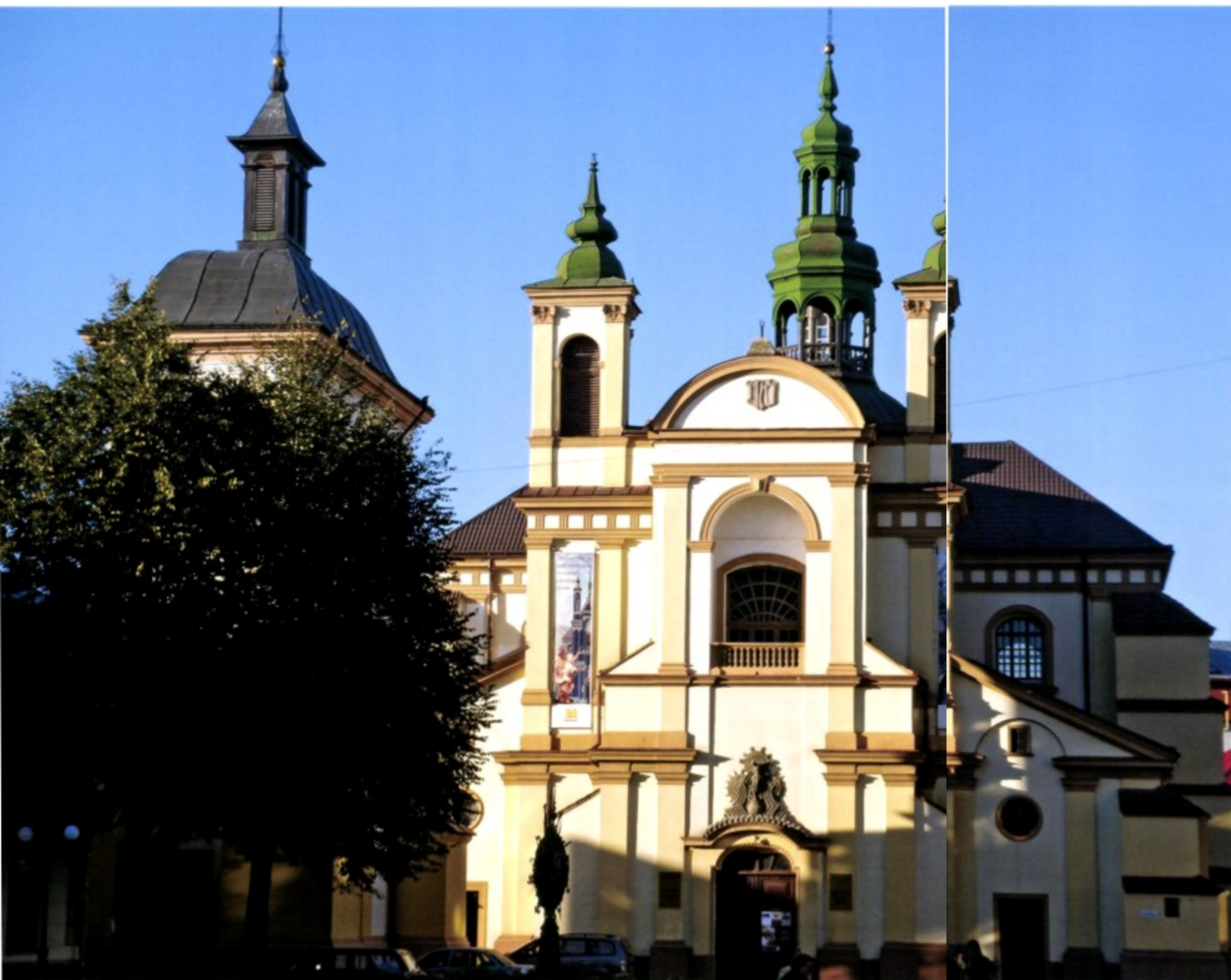
Links: Eines der schönsten Ensembles von Ivano-Frankivsk ist die ehemalige Armenische Kirche. Der barocke Bau war zu Sowjetzeiten ein Atheismuseum und wird heute von der ukrainisch-orthodoxen Kirche genutzt.