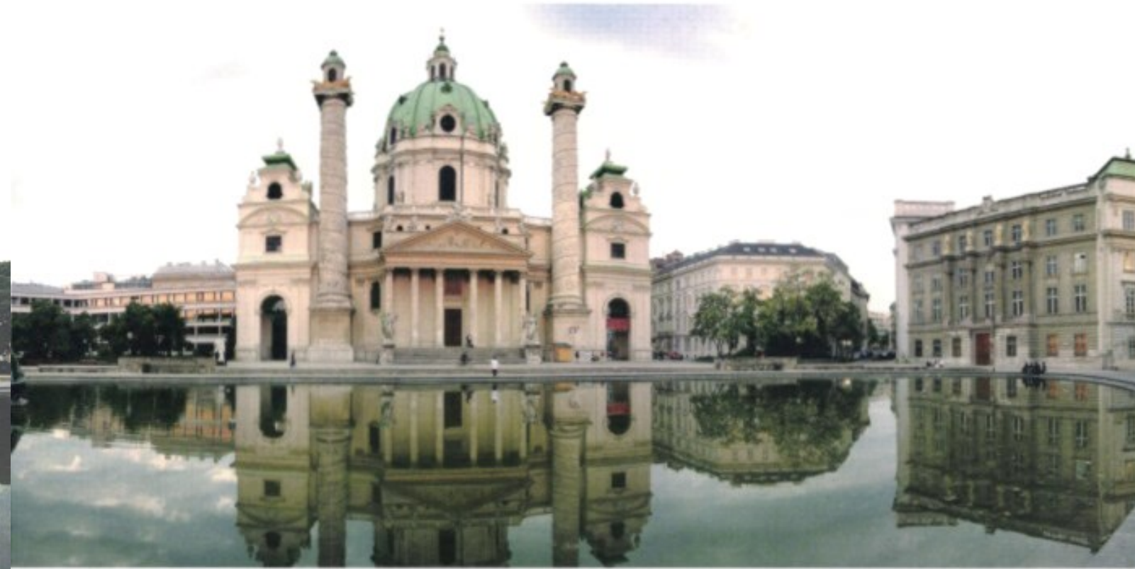
Oben: Karlskirche mit Teich und Henry-Moore-Plastik.