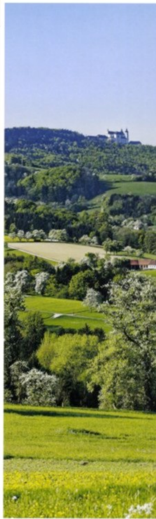
Links: Zur Blütezeit im Frühjahr breiten die unzähligen Birn- und Apfelbäume einen weißen Schleier über das Hügelland.