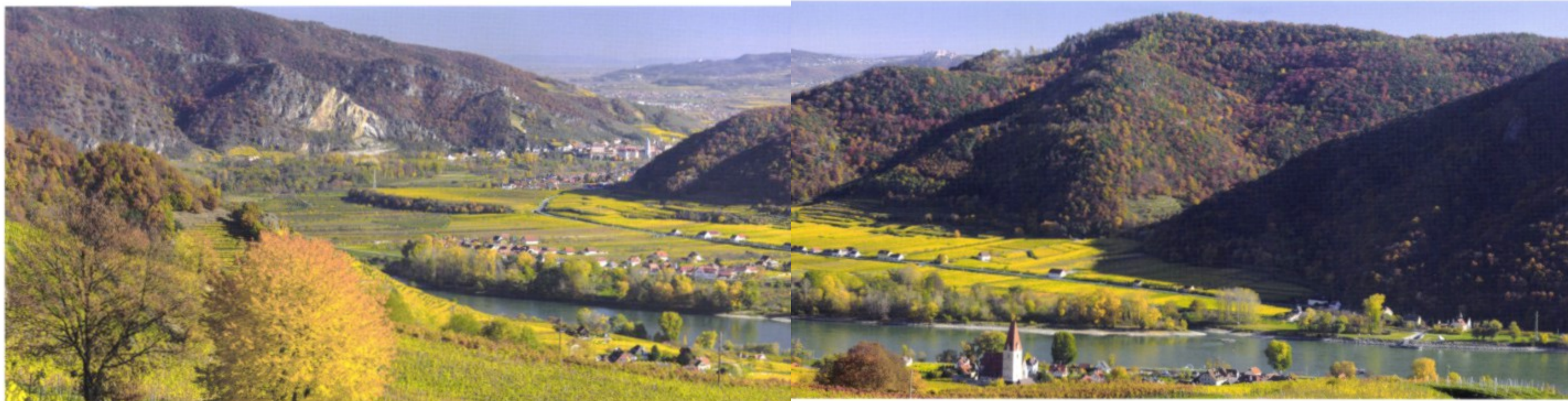
Oben: Die Wachau ist ein enges Durchbruchstal der Donau zwischen dem Benediktinerstift Melk und der Stadt Krems. Hier vereinen sich Wein- und Obstgärten, mittelalterliche Dörfer, Burgen und Klöster zu einer Kulturlandschaft.