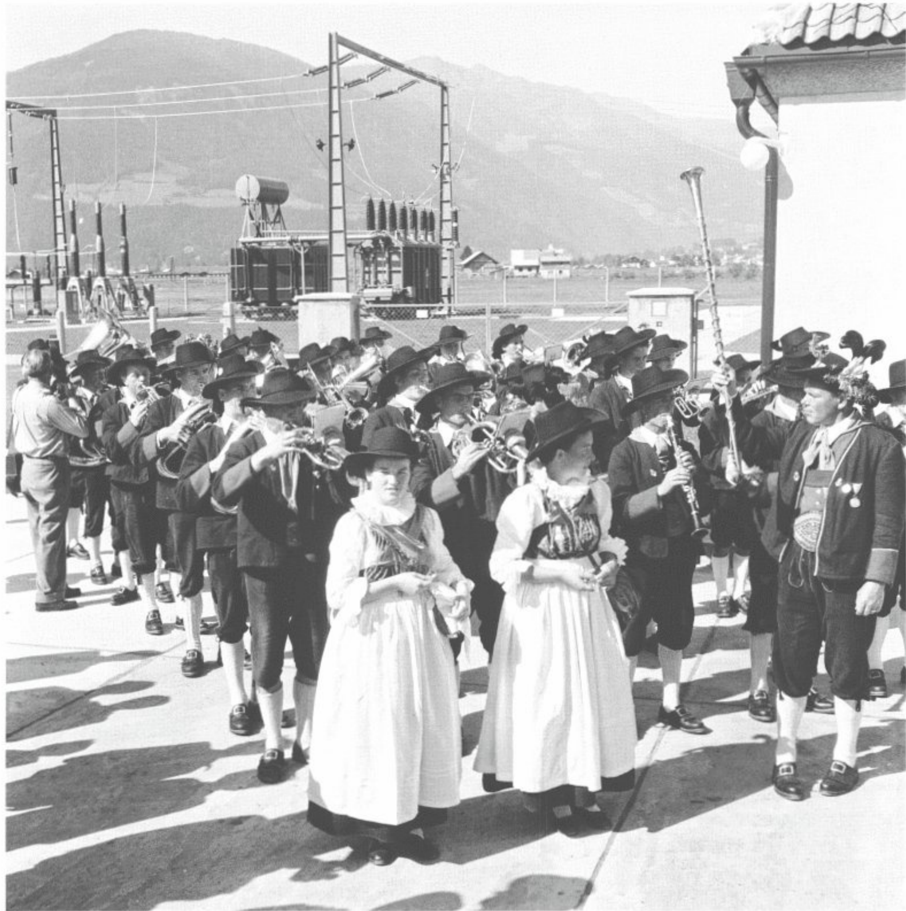
Tiroler Marketenderinnen und blechblasende Schützen sorgen bei der Eröffnung eines Umspannwerks in Lienz für den stimmungs- und schwungvollen Rahmen.