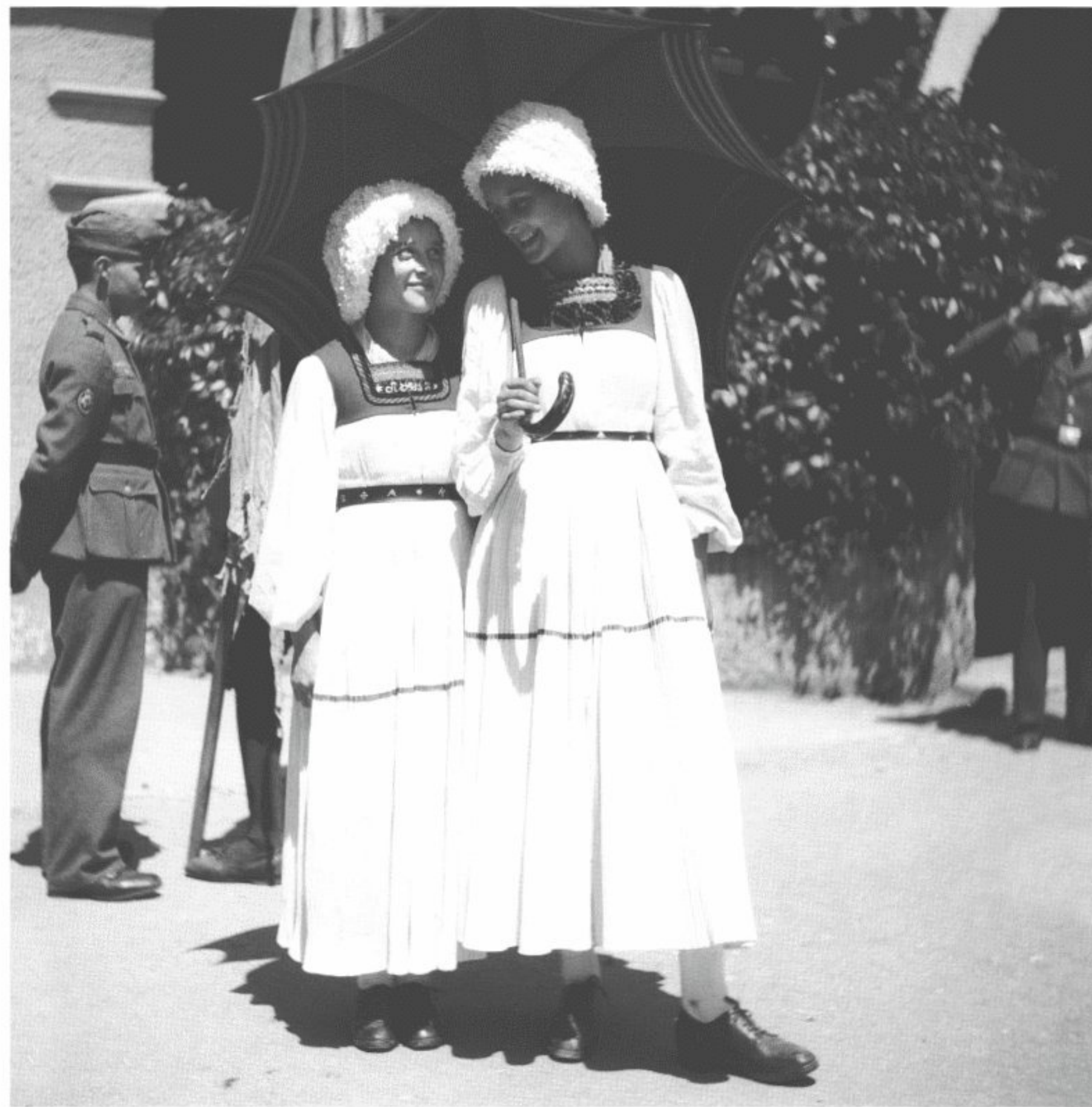
Brauchtumpflege auf Vorarlbergerisch: Zwei Mädchen stellen bei einem Umzug stolz ihre Bregenzerwälder Tracht zur Schau.