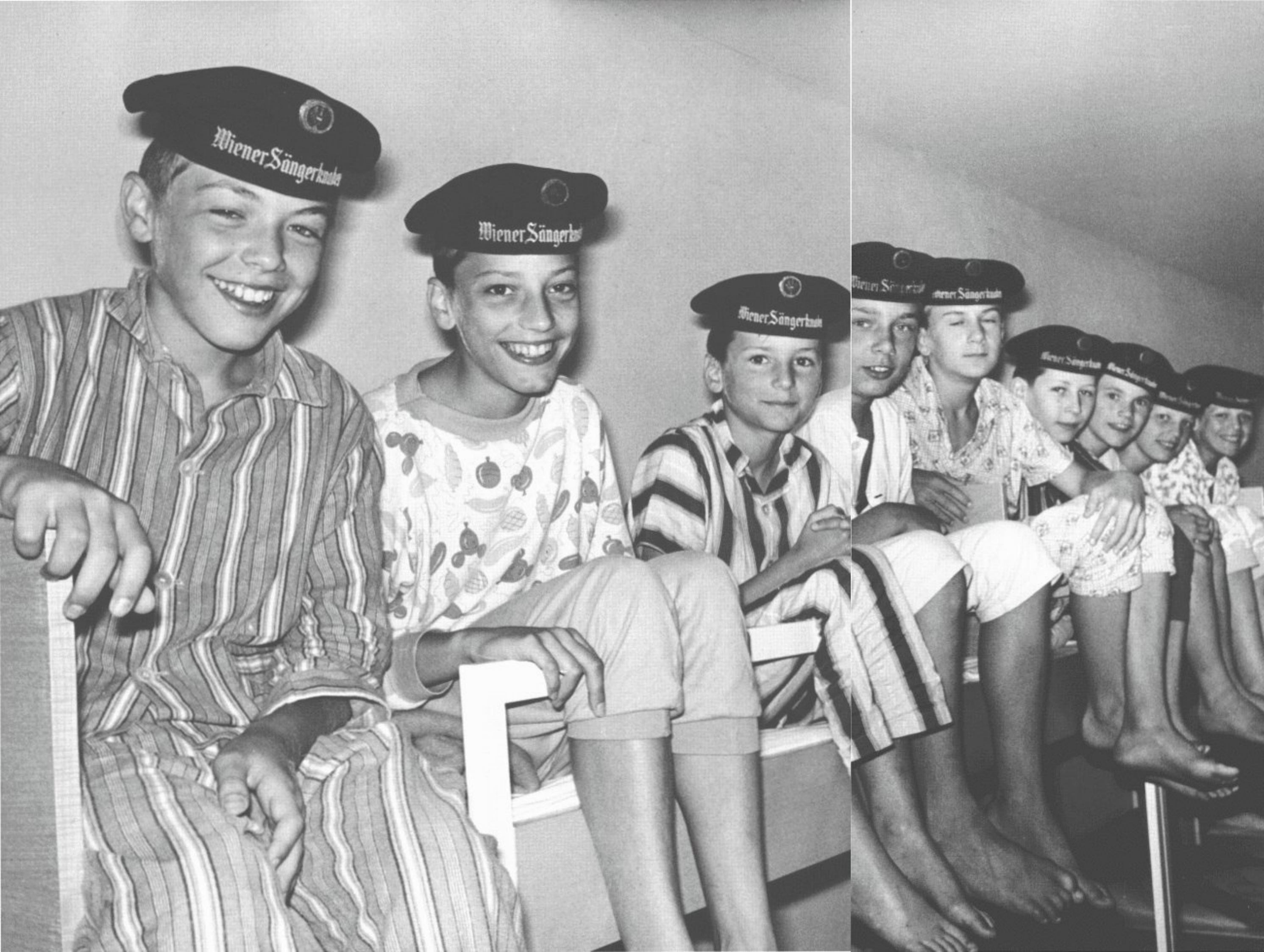
Die Wiener Sängerknaben einmal ganz inoffiziell im Pyjama auf den Stockbetten ihres Internats im Augarten.