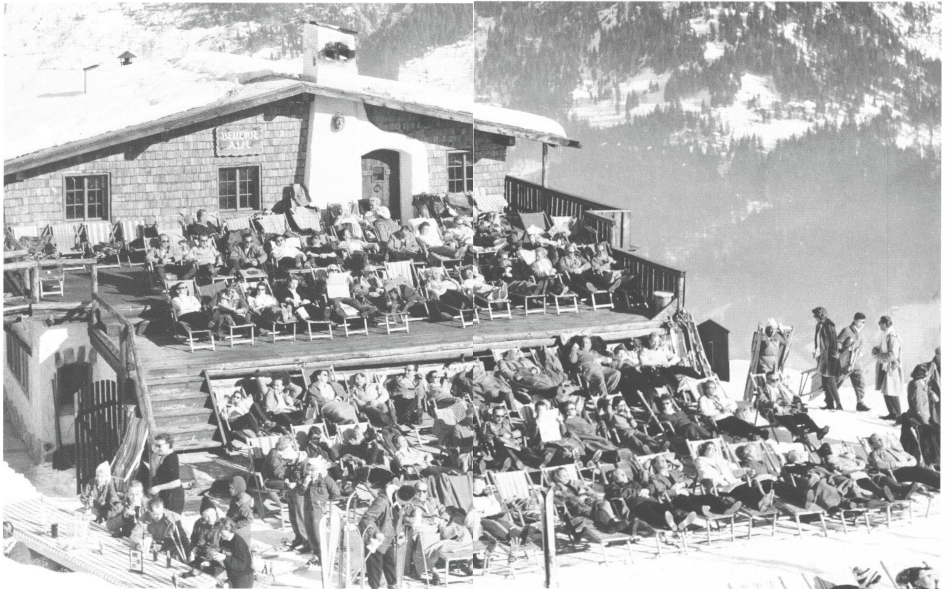
Ein kollektives Sonnenbad auf der Bellevue-Alm in Bad Gastein, 1958.