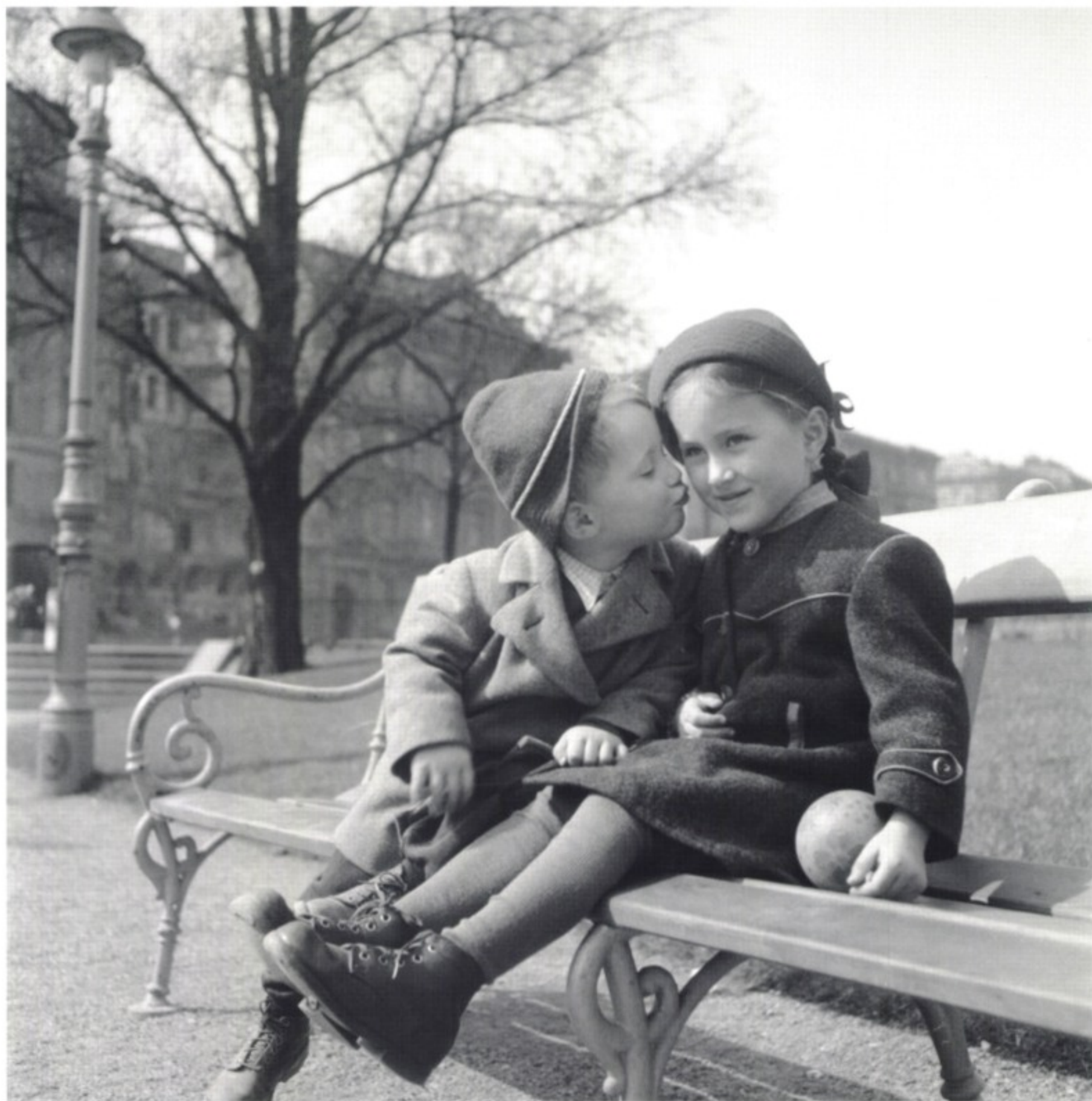
Frühling in Wien 1949: Vierjähriger küsst Fünfjährige.