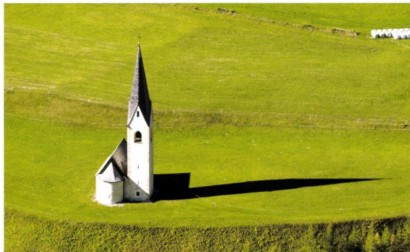
Ein Blickfang für Gäste des Osttiroler Dorfes Kals ist das romanische Dorfkirchlein St. Georg. Es steht zwischen den Ortsteilen Unterburg und Grossdorf auf freier Flur und trägt das Weihenatam 1366. Was seinen Reiz erhöht, ist der Panoramablick auf den Großglockner, Österreichs höchsten Berg, zu dessen Füßen Kals liegt.

Einfacher als seine Seele und Geschichte lässt sich Tirols Geografie erfassen: Das 12 648 Quadratkilometer große, von nicht einmal 700 000 Menschen bevölkerte Land – von dessen Fläche sich nur 14 Prozent zur Besiedelung eignen – wirkt auf der Karte übersichtlich gegliedert. Über seine gesamte Länge, vom Finstermünzpass an der Grenze zur Schweiz bis ins 180 Kilometer entfernte, beinahe schon bayrische Erl, wird es vom Inntal zerteilt. Zu beiden Seiten schneiden Zubringertäler