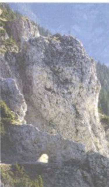
Ein Tor zum Ausblick auf das Wiener Neustädter Becken beim Wandern auf der Rax.

Ein besonderer Reiz Niederösterreichs: Höhenstraßen durchs weite Land (im Bild der Blick von der Moststraße in die Eisenwurzen).