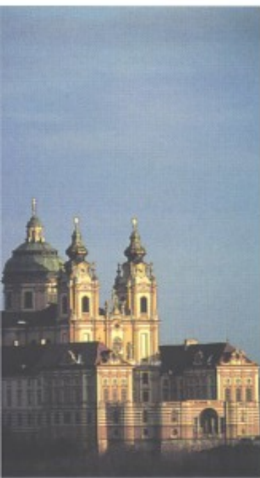
Mächtig und weltberühmt: Stift Melk an der Donau.