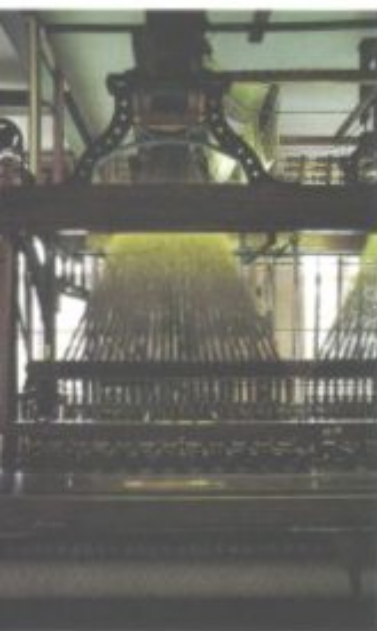
Unten: Zeugnis frühindustriellen Reichtums: der Turm der barocken Pfarrkirche von Groß-Siegharts.