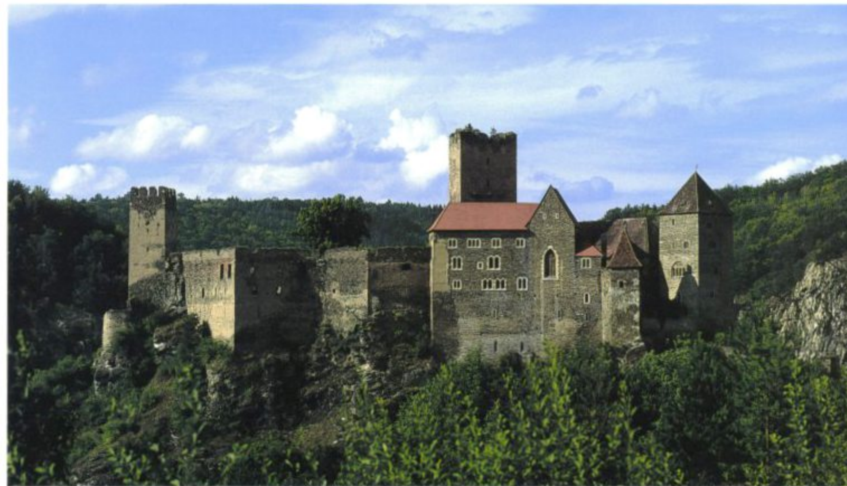
Die Burg von Hardegg, der kleinsten Stadt Österreichs – und wohl eine der idyllischsten.