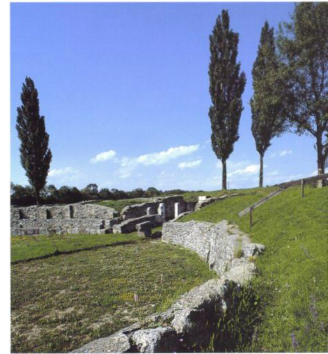
Auf den Spuren der Römer in Niederösterreich: der Archäologische Park Carnuntum.

Unübersehbares Charakteristikum vieler Orte in