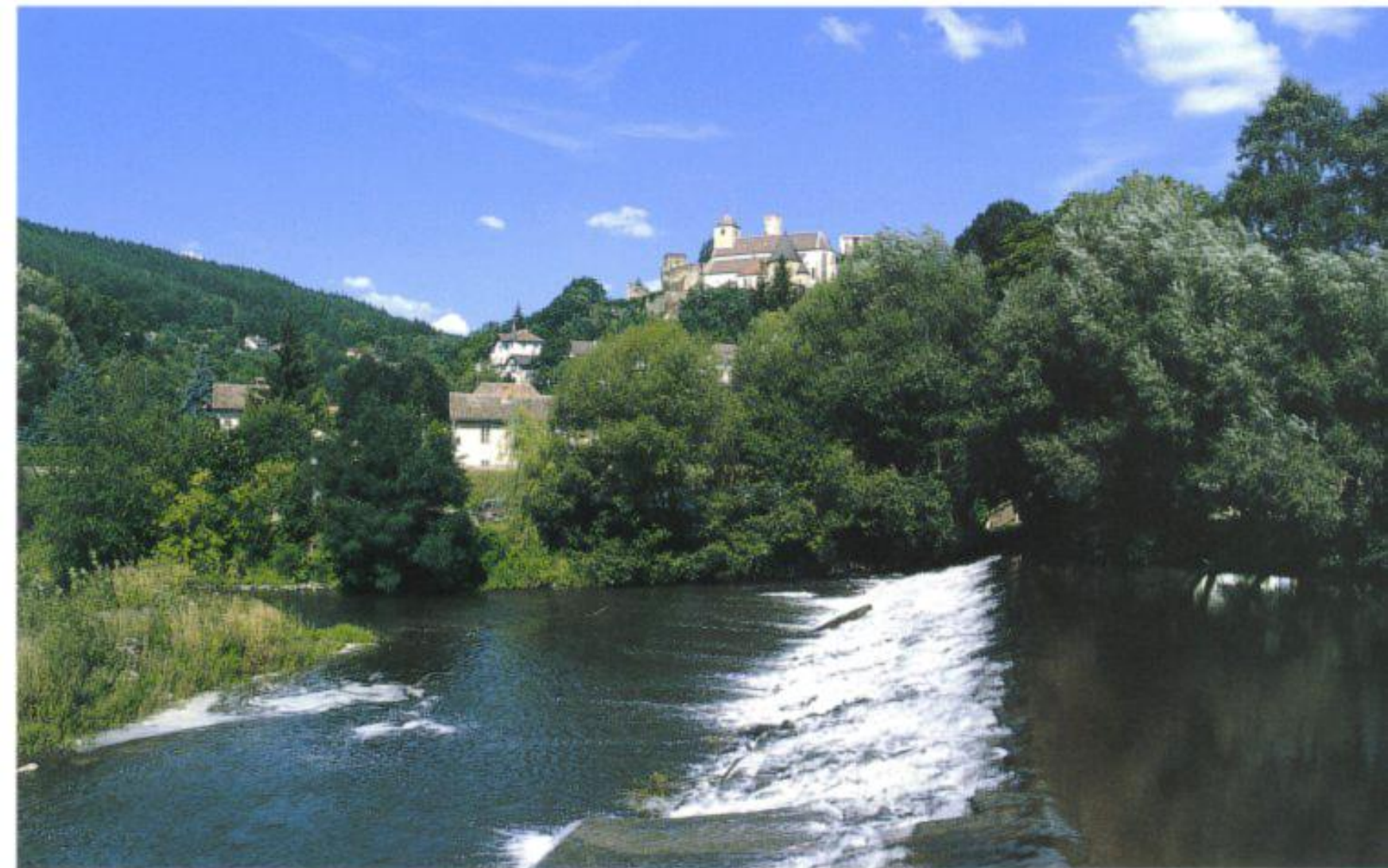
Hoch über dem Kamp: die Burgruine mit der Gertrudikirche von Gars.