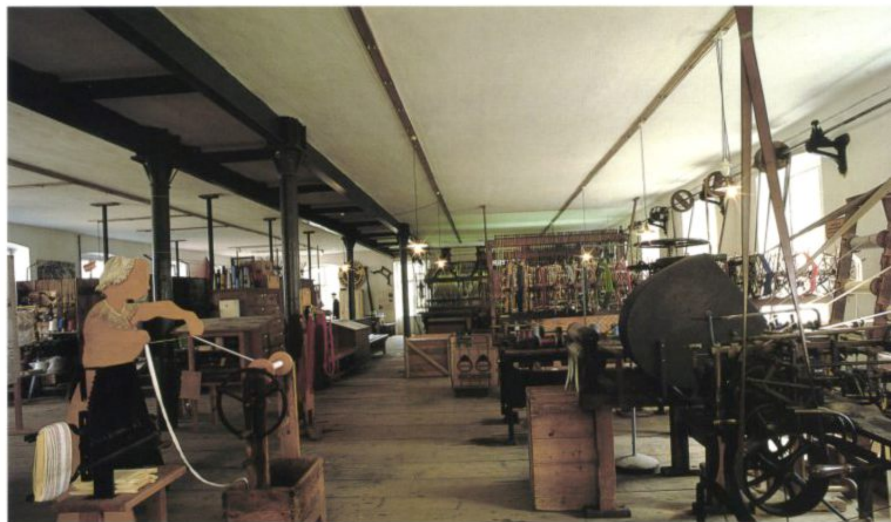
Oben und gegenüber oben: Ein Fenster in alte Arbeitswelten. Das „Lebende Textilmuseum“ in Groß-Siegharts.