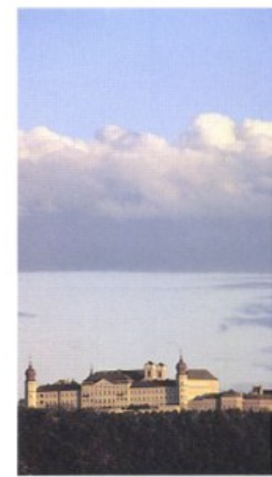
Ebenfalls am rechten Donauufer: Stift Göttweig.