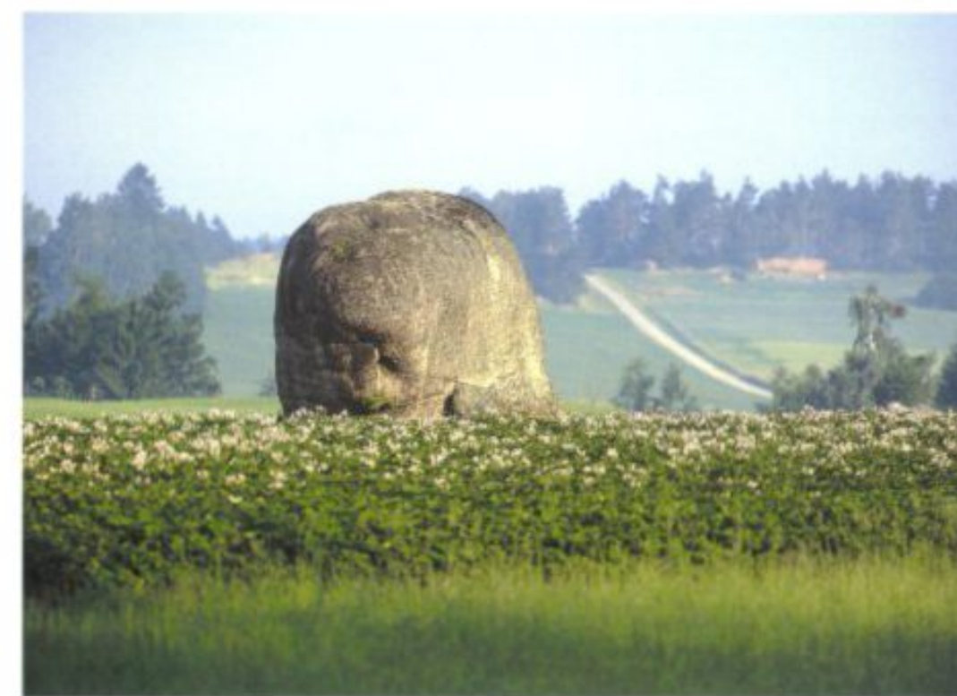
Das Waldviertel ist – vor allem im Nordwesten – übersät mit solchen von Wind und Wetter geformten Granitblöcken.

ausgebaut und gesichert. In dieser Zeit begann sich erstmals der Name Niederösterreich für das Land unter der Enns durchzusetzen. Und dieses Land erlebt eine bislang ungeahnte kulturelle Blütezeit: Heiligenkreuz, Klosterneuburg, Herzogenburg, Altenburg ... wurden um-, aus- oder sogar neu erbaut, die Marchfeldschlösser entstanden, Kirchen wurden barock ausgestattet, Bürger- und Bauernhäuser erhielten ihre teilweise pompöse Dekoration – und St. Pölten wurde zur Perle des Barock: Kenner der Materie halten die Stadt für ein Kleinod der Baukunst des 17. und 18. Jahrhunderts. Was damit zusammenhängt, dass sich zu dieser Zeit um den hier ansässigen Jakob Prandtauer eine regelrechte Künstlerkolonie versammelte: die Familien Munggenast und Wißgrill, Bartolomeo Altomonte, Daniel Gran und Paul Troger lebten und wirkten in St. Pölten. Erst das Ende des 18. Jahrhunderts brachte eine Zäsur: Es war das Jahrzehnt Josephs II., der durch seinen geradezu radikalen Reformierungswillen Hochadel und Klerus ihrer nahezu unumschränkten Macht enthob, damit aber dem Mäzenatentum einen empfindlichen Schlag versetzt. Die Aufhebung vieler Klöster wiederum schadete diesen – kunst- und architekturhistorisch gesehen – immens. Sozial gesehen hat Joseph II. dem Fortschritt allerdings tatsächlich auf die Sprünge geholfen – Toleranzpatent (also die Aufwertung anderer Religionsgemeinschaften gegenüber dem