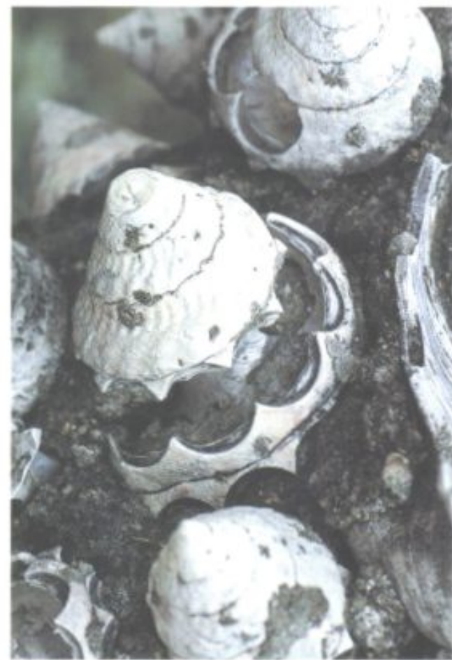
Was bleibt, wenn aus den gleißenden Muschelschalen die Perlmutterknöpfe gestanzt worden sind.