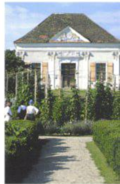
Der Garten von Schloss Schiltern im Gföhler Wald: ein Refugium für vom Aussterben bedrohte Nutzpflanzen.

und Fin de Siècle, en vogue waren, still und heimlich Wiederauferstehung – Gutenstein beispielsweise, Payerbach-Reichenau, der Semmering und auch das untere Kamptal. Letzterem als einer besonders nostalgischen und daher charmanten Natur- und Kulturlandschaft soll auf diesem Ausflug unser Augenmerk gelten. Als dem beschaulichen Ambiente angemessenes Fortbewegungsmittel sei das Fahrrad empfohlen. Diese Region, in der sich der an seinem Oberlauf eher düstere Kamp, dieser immerhin bedeutendste Fluss des nordwestlichen Niederösterreich, anschickt, in das sonnige Tal der Donau zu münden, wird seit Menschengedenken vom Wein geprägt. Nicht zufällig ist Langenlois, ihr fast schon tausend Jahre altes städtisches Zentrum, Österreichs größte Weinbaugemeinde, deren zirka achthundert Winzer heutzutage auf rund 2200 ha Rieden pro Jahr durchschnittlich zehn Millionen Liter Rebensaft produzieren. Wer also Langenlois, das in frühen Urkunden vielsagend Liubisa , die Liebliche, heißt, besucht, kommt nicht umhin, in der reich sortierten Vinothek des