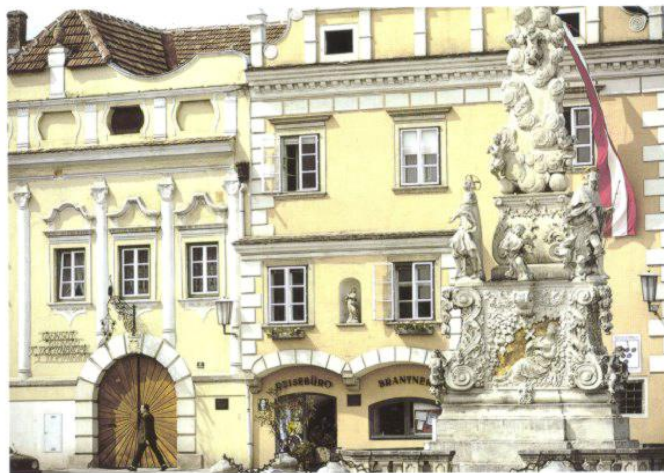
Der von Renaissancefassaden umrahmte Hauptplatz von Langenlois mit der barocken Peststule.

Ab hier beginnt der Kampoi , der Krumme, wie