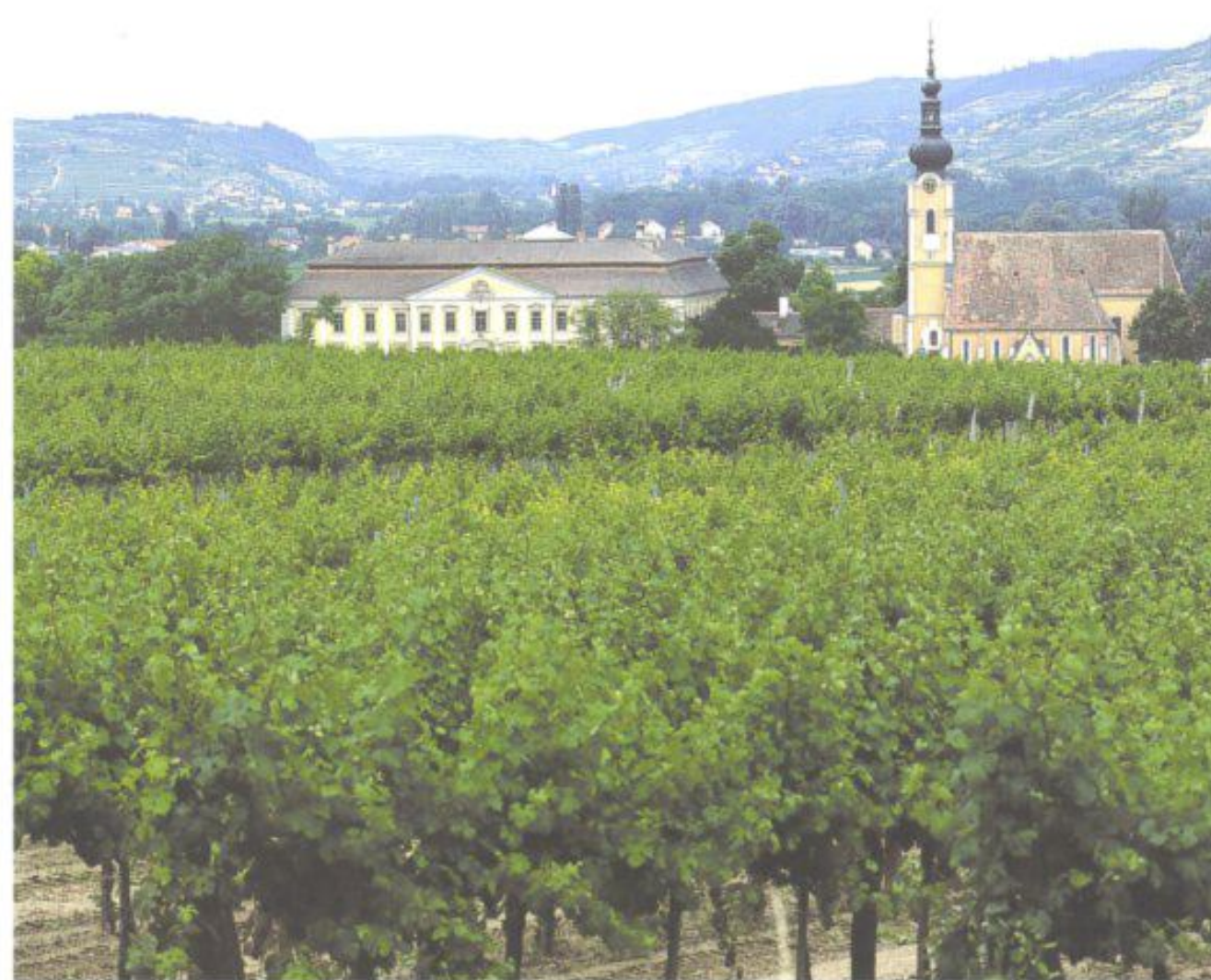
Schloss Gobelsburg, in dessen barocken Räumlichkeiten das Wiener Volkskundemuseum eine Außenstelle betreibt.

die einst hier siedelnden Kelten den Fluss nannten, seinem Namen alle Ehre zu machen und heftig zu mäandrieren. Stiefern, Plank und Buchberg heißen die folgenden Ortschaften, die sich male-ri-sch in seine Knie schmiegen. Den nördlichsten Punkt unserer Tour bildet die alte Marktgemeinde Gars. In dessen Burg, deren ruinöse Reste mitsamt der kunsthistorisch hochinteressanten Gertrudskirche auf hohem Fels über dem Ortsteil Thunau thronen, hatte Ende des 11. Jahrhunderts, bevor er seine Residenz nach Klosterneuburg (vgl. Kap. 42) verlegte, der Babenberger Markgraf Leopold II. seinen Sitz. Schon viel früher siedelten hier Kelten und Illyrer, ab dem 8. bis zum 11. Jahrhundert besaßen slawische Fürsten in der Gegend eine Burg. Archäologen förderten auf dem Schanzberg bei Thunau diesbezügliche Relikte zu Tage. Mittlerweile herrscht in Gars ein deutlich friedlicherer Geist, geprägt durch die neuen Sommerfrischler (siehe oben) und durch Österreichs Gesundheitspapst Willi Dungal. Und durch die Arienmelodien, die von Mitte Juli bis Mitte August die Sänger/innen des Opern-Air-Festivals von der Bühne im Hof der Burgruine bei Schönwetter in die lauschige Sommerluft schicken.