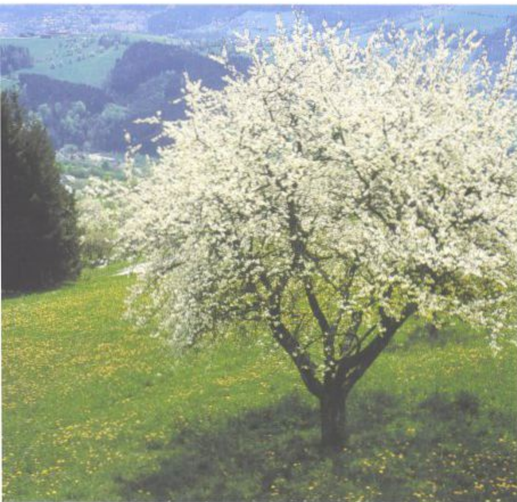
Ein Meer von blühenden Obstbäumen überzieht jedes Jahr im Frühling das Land.

der Weinviertler Landschaft sind die Hausberge: Keine geologische Besonderheit, sondern künstliche Erdaufschüttungen, die man früher als hallstattzeitliche Tumuli zu identifizieren beliebte (weil auch solche im Weinviertel häufig zu finden sind – Großmugl beispielsweise). Die Enttäuschung kann man sich vorstellen, als man entdeckte, dass die Hausberge aus dem Mittelalter stammen, wo sie ausschließlich der Verteidigung dienten: Heute weiß man, dass auf ihnen „Kreuzfeuer“ entzündet wurden, um von Ort zu Ort das Herannahen von Feinden zu melden. Die beeindruckendsten Hausberge findet der Reisende im Hasterberg bei Eichenbrunn, im Glockenberg bei Hagenberg oder im Hutsaul bei Altlichtenwarth. Was die Hausberge aber so besonders attraktiv macht: Kaum sonst wo hat man einen derart weiten Blick übers Land, der einem vor allem sommers den Eindruck gibt, man stünde am Ufer eines Ozeans in den Farben Grün und Ocker.